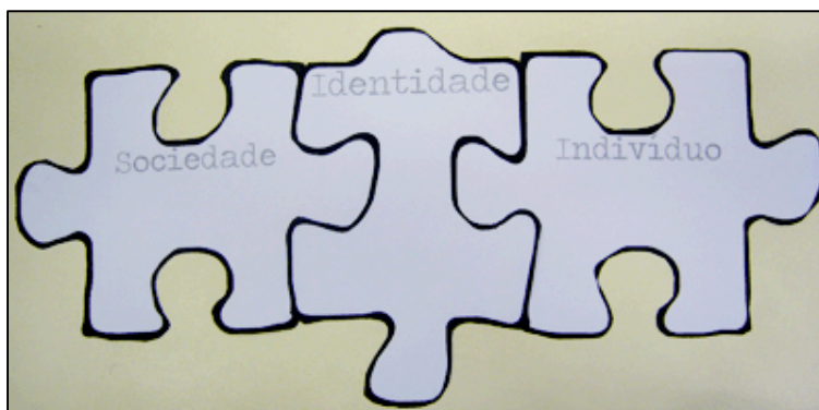
Figura 4 – Quebra-cabeça montado

Após a execução das atividades, a avaliação de toda a produção é feita com base nas fichas confeccionadas pelos participantes, que serão catalogadas em imagem e texto e depois expostas no ambiente como instalação interativa, dispostas em uma superfície ou penduradas em um varal de exposição, onde as diversas concepções descritas nas fichas podem se encaixar, não ficando necessariamente presas às produções individuais. Deste modo, o público que interagir com a instalação poderá mover as peças e formar, de acordo com sua leitura e interpretação da produção exposta, seu quebra-cabeça customizado.